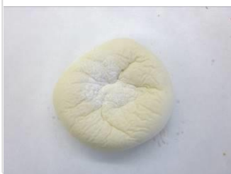
白いクリーム チーズパン No.7 ¥180