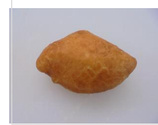
カスタード ドーナツ No.21 ¥180