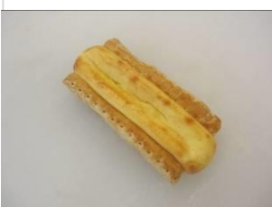
NY チーズ ケーキパイ No.12 ¥200