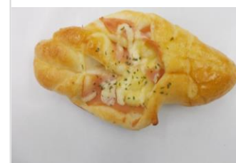
ハムチーズパン No.14 ¥180