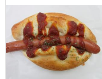
ピリ辛 ウインナーパン No.17 ¥180