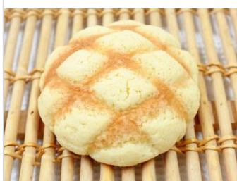
メロンパン No.5 ¥180