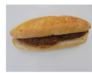
クロックパン No.18 ¥180