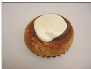
シナモンロール No.10 ¥180