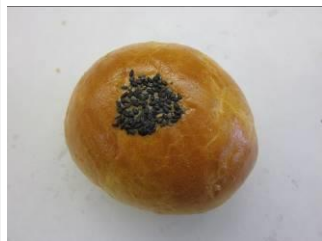
あんパン No.1 ¥180