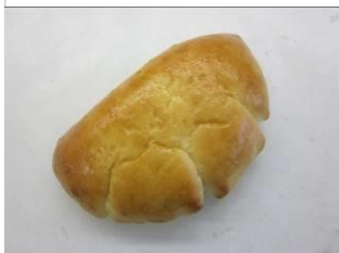
クリームパン No.2 ¥180