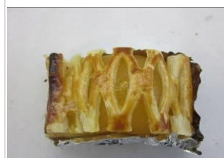
アップルパイ No.11 ¥220