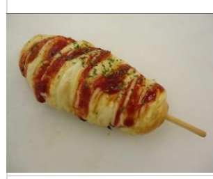
ウインナロール No.16 ¥180