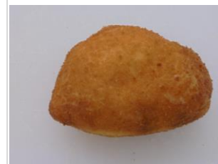
カレードーナツ No.22 ¥180