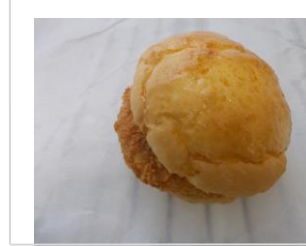
メンチカツドッグ No.19 ¥180