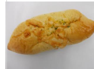
ツナちくわパン No.15 ¥180