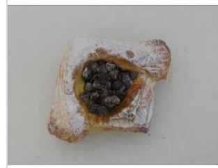
チョコデニッシュ No.13 ¥200