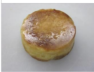
クイニーアマン No.8 ¥180