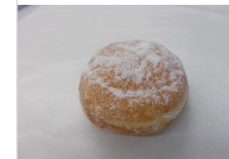
あんドーナツ No.23 ¥180