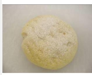
カスタード メロンパン No.6 ¥200