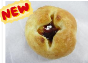
グラスメロンパン