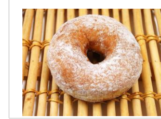
リングドーナツ No.20 ¥180