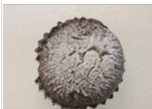
フォンダンショコラ No.3 ¥180