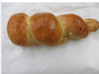
チョココルネ No.4 ¥180